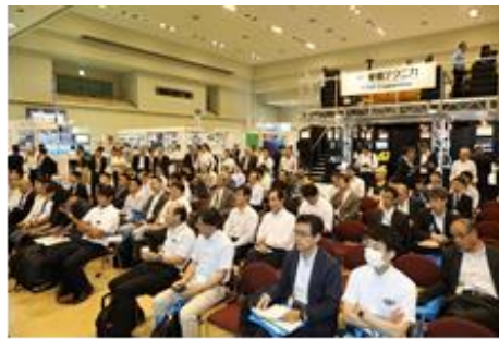
これまでの Techno-Ocean 展示会開催の様子